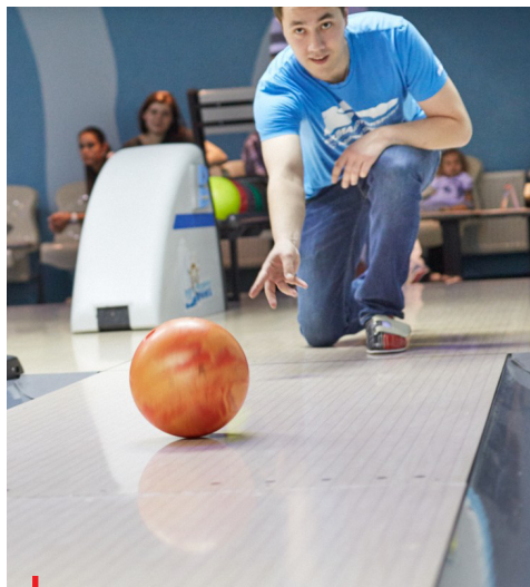
Je opravdu bowling pro Čechy nejlákavějším sportovním odvětvím?

Národní sportovní rada vznesla připomínky Kontroverzním výzkumem se intenzivně zabývala na svém mimořádném jednání také Národní sportovní rada, poradní orgán při Národní sportovní agentuře, kterou na základě podnětů ze sportovního prostředí svolal Milan Hnilička.