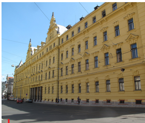
Budova Městského soudu v Praze